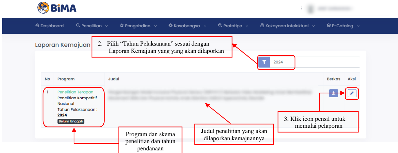
Gambar 1. Submenu Laporan Kemajuan

Pelaporan dilakukan dosen/peneliti berdasar pada tahun pelaksanaan penelitian dan program penelitian yang telah atau sedang dilaksanakan. Apabila pemilihan menu “Laporan Kemajuan” (Gambar 1) dilalui, maka informasi Laporan Kemajuan Penelitian dapat dipilih untuk melakukan pengisian dan proses pengunggahan dokumen-dokumen pendukung sebagaimana yang telah dituliskan dalam proposal penelitian. Informasi Laporan Kemajuan ditampilkan dalam Gambar 2 berikut.