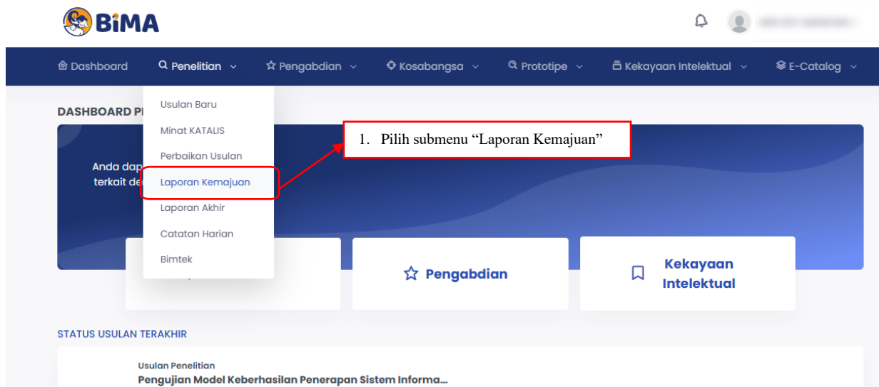
Gambar 1. Submenu Laporan Kemajuan

Pelaporan kemajuan penelitian dilakukan melalui BIMA dengan menggunakan user dan password yang sama yang telah dimiliki oleh dosen. Pilihan melaporkan kemajuan penelitian dapat diawali dengan memilih menu “Penelitian” dan submenu “Laporan Kemajuan” sebagaimana ditampilkan pada Gambar 1.